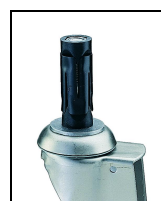
bev. 5 ronde expander voor buis