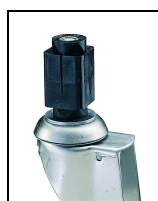
bev. 2 vierkante expander voor buis