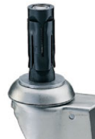
bev. 5: expander voor ronde buis