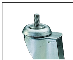
bev. 3 inbusbout M10x30