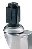
bev. 2: expander voor vierkante buis