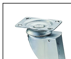
bev. 6 plaatbevestiging

**Uitvoering wiel kan afwijken van getoonde foto!!