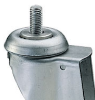
bev. 3: bevestiging dmv inbusbout