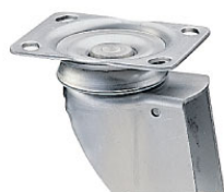
bev. 6: plaatbevestiging