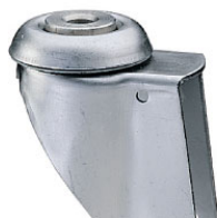
bev. 0: boutgatbevestiging